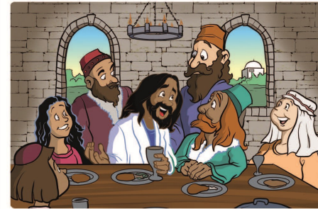
Tegning: Trevor Keen

Disse to bildene er nesten helt like. Klarer du å finne 5 feil på det ene bildet?